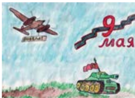
Рис. «Парад Победы», Эмилия Джантемирова, 5 «Б»