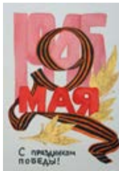
Рис. Евгении Патрушевой, 4 Б