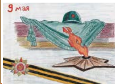
Рис. «Вечный огонь», Эмилия Джантемирова, 5 «Б»