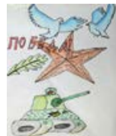
Рис. Анны Шашковой, 1 «В»